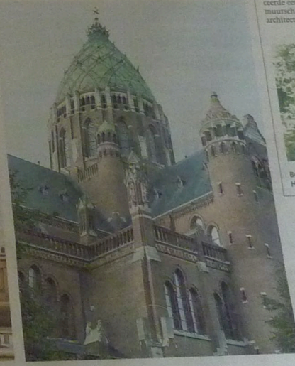
Nieuwe Bavo met twee onbewerkte plekken (in cirkels).