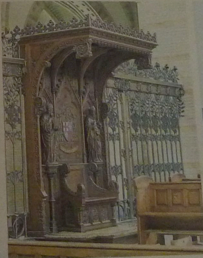
Preekstoel van de hand van kunstenaar Jan Brom.