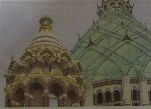
Apistoren, met gereconstrueerde kleuren.